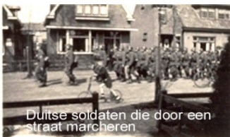
Marcherende Duitse soldaten

Nederland was een rijk land en de winkels lagen vol met schoenen, textiel, levensmiddelen en dingen die we nu ook heel gewoon vinden. De Duitse soldaten kochten die spullen en stuurden ze naar huis. Voor de Nederlanders niet zo leuk, want zo bleef er steeds minder voor hen over. Later pikten ze alles zelfs gewoon in. Aan het eind van de oorlog pakten ze zomaar je fiets af.