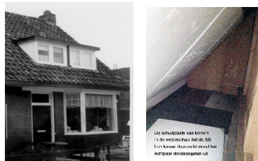
Onder schuine gedeelte van de dakkapel was een schuil- plaats voor onderduikers

Ik heb al verteld dat er mensen waren die de Duitsers in alles tegenwerkten. Ze zaten in het verzet. Meestal vormden ze een groep en ze zorgden voor onderduikadressen, ze spioneerden voor de Engelsen en deden verder alles om het de Duitsers lastig te maken. Mijn vader was ook in het verzet. De groep waartoe hij behoorde heette de "Oranje Vrijbuiters", maar heel erg, in augustus 1943 werden ze verraden. Bijna allemaal werden ze gevangen genomen en naar een gevangenis in Scheveningen gebracht. Toen ze daar ongeveer een half jaar in een cel opgesloten zaten, vaak gemarteld werden en bijna geen eten kregen, zijn er op 29 februari 1944 achttien, waar mijn vader bij was, op de Waalsdorpervlakte gefusilleerd. Een moeilijk woord voor doodgeschoten. Ik heb een website gemaakt waar je alles over mijn vader en zijn verzetsvrienden kunt