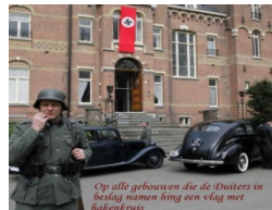
Vlaggen met een hakenkruis