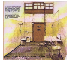
De "dodencel" 601 in de gevangenis

Mijn vader werd gefusilleerd omdat hij zich tegen de Duitsers verzette. Niet alleen omdat ze het Nederlandse volk onderdrukten, maar ook omdat ze joden (maar ook andere mensen) naar kampen stuurden, waar ze vergast werden en door honger en ziekte omkwamen. Zo zijn miljoenen mensen van hun leven beroofd en ik hoef je niet te vertellen hoe verschrikkelijk veel verdriet dat heeft gegeven. Als je dan ook nog weet dat door de Tweede Wereldoorlog over de hele wereld 54 miljoen mensen om het leven zijn gekomen, dan beseft je nog meer hoe erg die oorlog is geweest.