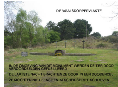
Monument op de Waalsdorpervlakte waar 250 mensen gefusilleerd zijn