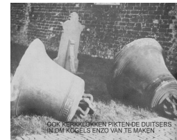
Kerkklokken werden ingepikt

Ook moesten de radio's ingeleverd worden. Want daarmee kon je naar Engelse nieuwsberichten luisteren. En dat mocht niet. Ook mochten de kranten niet schrijven wat ze wilden. Alleen wat de Duitsers goed vonden.