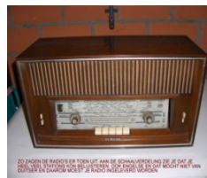
Radio moest ingeleverd worden