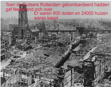
Toen de Duitsers Rotterdam gebombardeerd hadden gaf Nederland zich over Er waren 800 doden en 24000 huizen waren kapot

Je weet, de tweede wereldoorlog begon omdat Hitler, die de leider van Duitsland was, de baas over heel Europa wilde worden. Daarvoor stuurde hij zijn leger erop uit om zoveel mogelijk landen te veroveren, en op 10 mei 1940 vielen zijn soldaten Nederland binnen. De Nederlandse soldaten boden wel flink weerstand, maar toen de Duitsers op 14 mei lukraak bommen op Rotterdam gooiden, gaf Nederland zich de dag erna, op 15 mei, over.