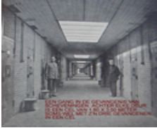
Een gang in de gevangenis met aan met aan weerszijden cellen

lezen. Die site heet www.oranjevrijbuiters.nl . Er staan ook veel links op waar je veel over de oorlog aan de weet kunt komen.